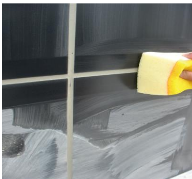
Limpeza do excesso de argamassa

Logo que o produto se apresente totalmente seco, proceder a uma limpeza geral com esponja húmida e seguidamente eliminar o excesso de pó com auxílio de um pano seco.