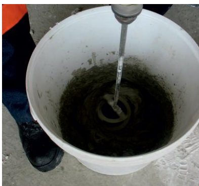
Amassadura do ADHERE Cor Flex