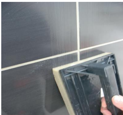
Limpeza do excesso de argamassa