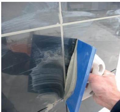
Betumação com ADHERE Cor Flex